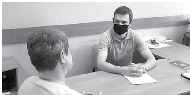
Представители адвокатской консультации Ленинского района №1 ведут прием граждан.

В мероприятии приняли участие 63 адвоката. Гражданам оказывалась юридическая помощь в ви-