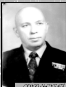
СОКОЛОВСКИЙ Георгий Дмитриевич