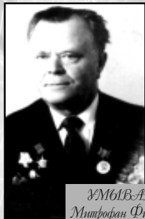
УМБЛВАКИН Митрофан Филиппович