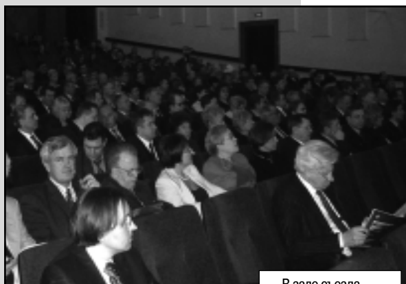
В зале съезда