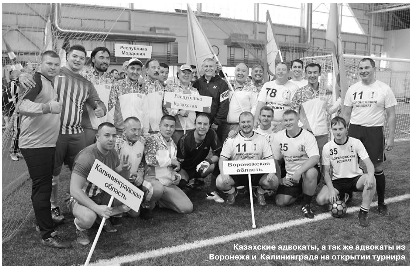
Казахские адвокаты, а так же адвокаты из Воронежа и Калининграда на открытии турнира